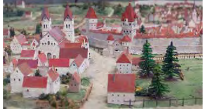
Das Marienmünster des Fürststifts Kempten vor den Toren der Reichsstadt Kempten (Situation vor dem Dreißigjährigen Krieg)